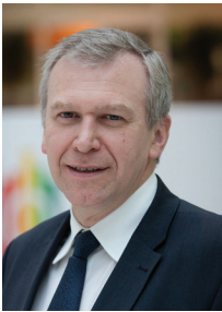
Yves Leterme Secrétaire général adjoint de l'OCDE

L'entrepreneuriat social, forme d'entrepreneuriat qui vise à concilier viabilité économique et impact social, fait l'objet d'un intérêt croissant de la part des décideurs politiques comme du grand public. L'augmentation des créations d'entreprises sociales, l'éclosion de chaires dédiées à cette thématique dans les écoles de commerce, la multiplication des incubateurs d'entreprises sociales, l'organisation de conférences et séminaires portant sur l'émergence de ce phénomène soulignent la vivacité de cet intérêt.